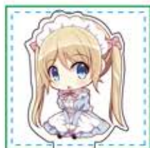
デザイン・カットパス 配置参考