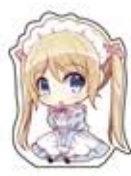
カットパスと 差込を用意