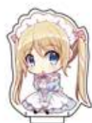
カットパスに 差込を差し込む